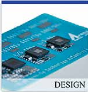
基板設計サービス