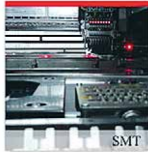
表面実装サービス