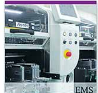
総合電子部品製造サービス