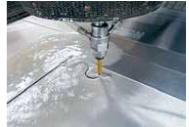
ウォータージェット加工