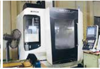
最新立型マシニング