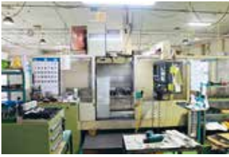
大物ワークに対応