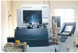
ワイヤー放電加工