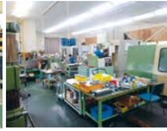
マシニングセンター