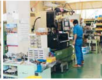
ワイヤー放電加工