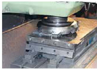
マグネットチャック加工