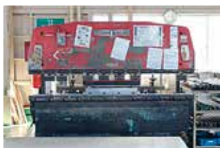
80トンプレスブレーキ