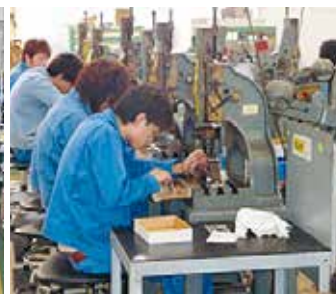
フットプレス作業風景