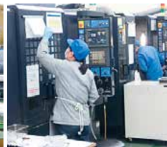
マシニング作業風景