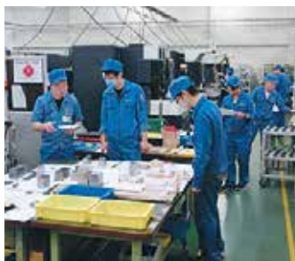
現場打合せ作業風景