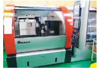
グラフィカルプロファイル