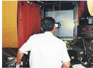
プロファイル研削盤