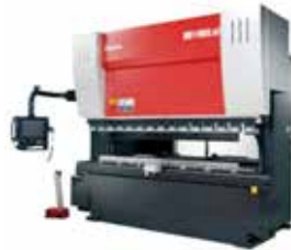
「高速・高精度ベンディングマシン」