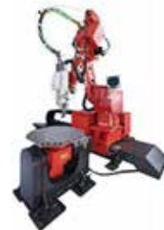
「ファイバー/アーク溶接ロボット」