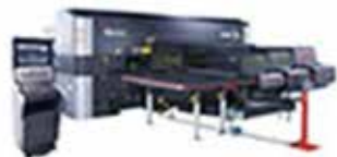
「ファイバーレーザ複合マシン」