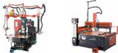
「テーブルスポット/NC スタッド溶接機」