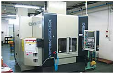
マシニングセンター