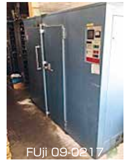
熱風循環式乾燥装置