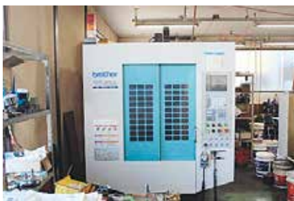
CNCタッピングセンター