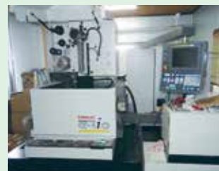
ワイヤー放電加工機