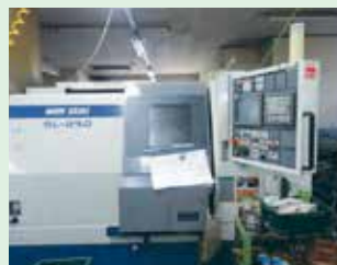
マシニングセンター