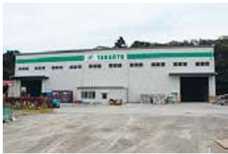
リサイクルセンター建屋