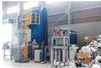
小型家電選別ライン