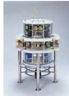
水中ロボット開発