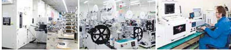
端子事業所：民生・産業用コネクタ、自動車電装用端子コネクタを一貫生産