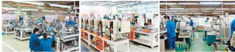
原町事業所：自動端子圧着機、各種精密プレス、バイスの産業用機械・器具を生産