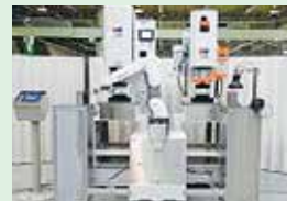
ロボットプレスシステム