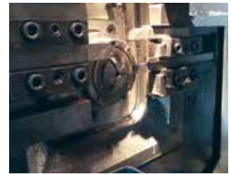
スイス式で加工しています