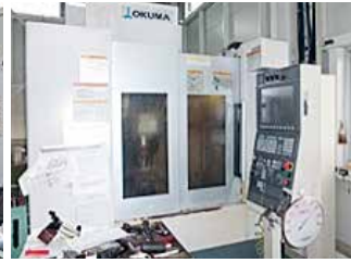
オークマ・マシニングセンター