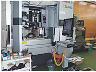
ワイヤー放電加工機