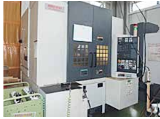
森精機・マシニングセンター