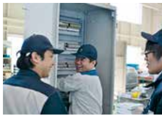
明るく高品質のものづくり