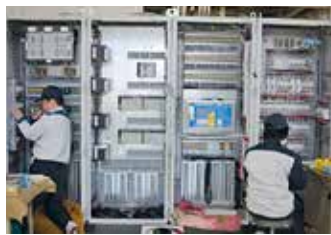
社員の技術力が自慢です