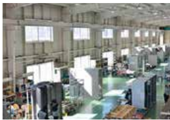
5Sを徹底し環境を整備