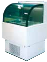
南極水展示ケース