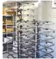
低高度用ドローン機体積重ね