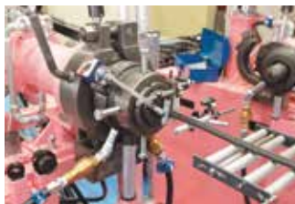
ゴム押出成形の様子