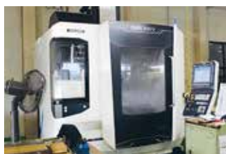
最新立型マシニング