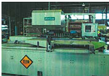
タレットパンチプレス