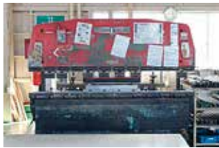
80トンプレスブレーキ