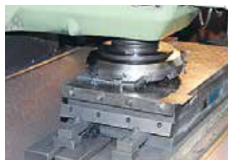
マグネットチャック加工