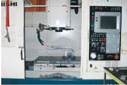
マシニングセンタ