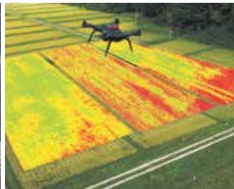
リモートセンシング