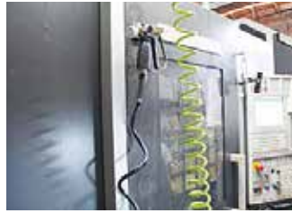
マシニングセンタ