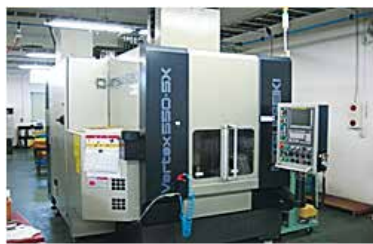
マシニングセンタ