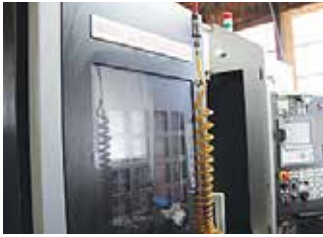
マシニングセンタ