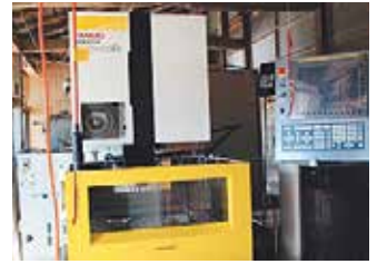
ワイヤー放電加工機