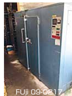
熱風循環式乾燥装置