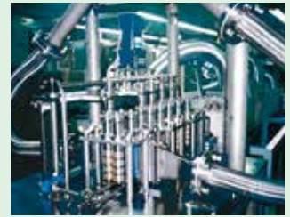
専用機 絶縁板付着装置