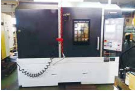
マシニングセンタ