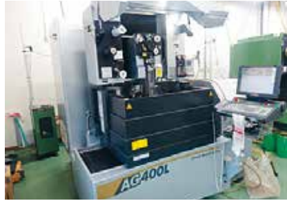
ワイヤー放電加工機