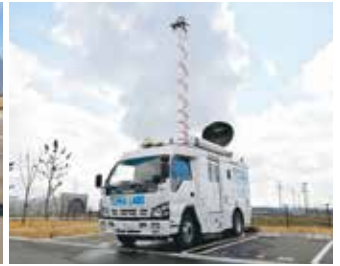
車両移動型地上管制局