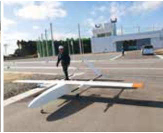
長距離固定翼試作機（翼長4m）