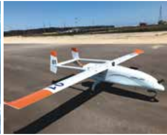
開発用固定翼無人機（翼長4m）