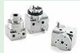
ロータリーチャック