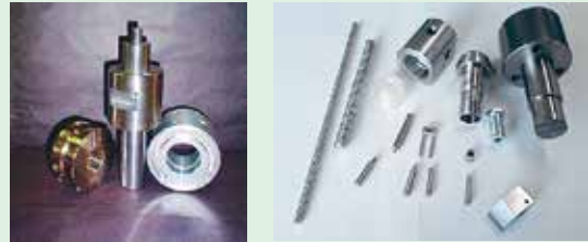
&lt; 複合旋盤加工品 &gt;