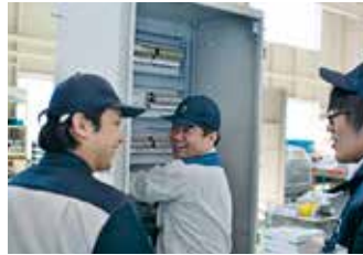
明るく高品質のものづくり