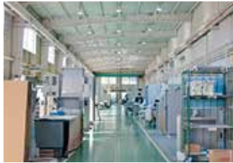
動線をシンプルにし効率化