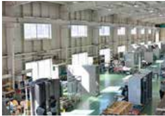
5Sを徹底し環境を整備