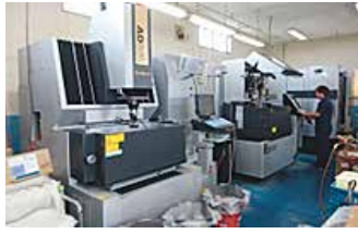
放電・ワイヤー放電