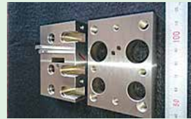
歯科矯正器具部品製造用抜き型。

歯科矯正器具の微細加工を主として、ミクロン単位の高精度加工技術を保有しております。