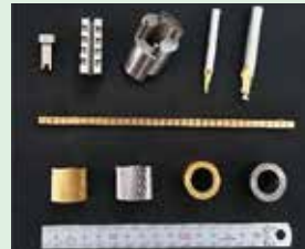
一般用精密部品加工及び精密研削加工(エンドミル成形加工等)。