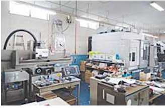
研磨・マシニング