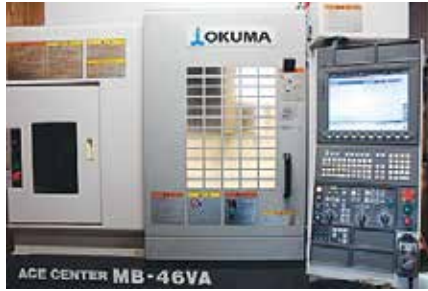
マシニングセンタ