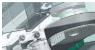
航空宇宙関連の加工装置