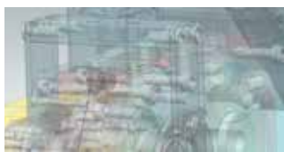
鉄道車両関連の加工装置