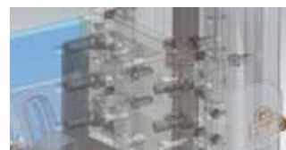
航空宇宙関連の生産設備装置