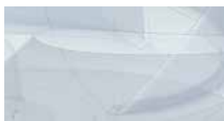
航空宇宙関連の3D加工品