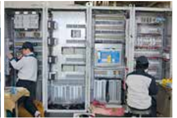
社員の技術力が自慢です