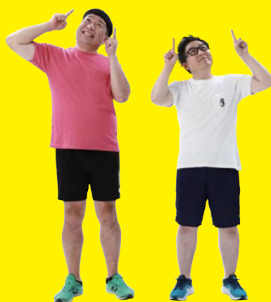
総合司会 ペんぎんナッツ (サンサンチャレンジアンバサダー)