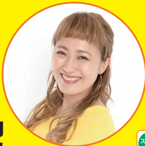
スペシャルゲスト 丸山桂里奈

1日2回朝食前と夕食後に体重を測り、スマホの「ふくしま健民アプリ」に記録するだけ。気軽に減量に挑戦できるサンサンチャレンジについてご紹介します。