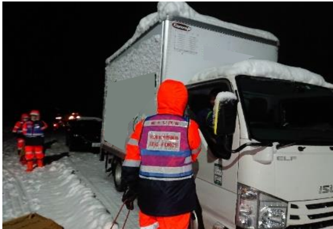
支援物資の配布 ＜国道8号＞