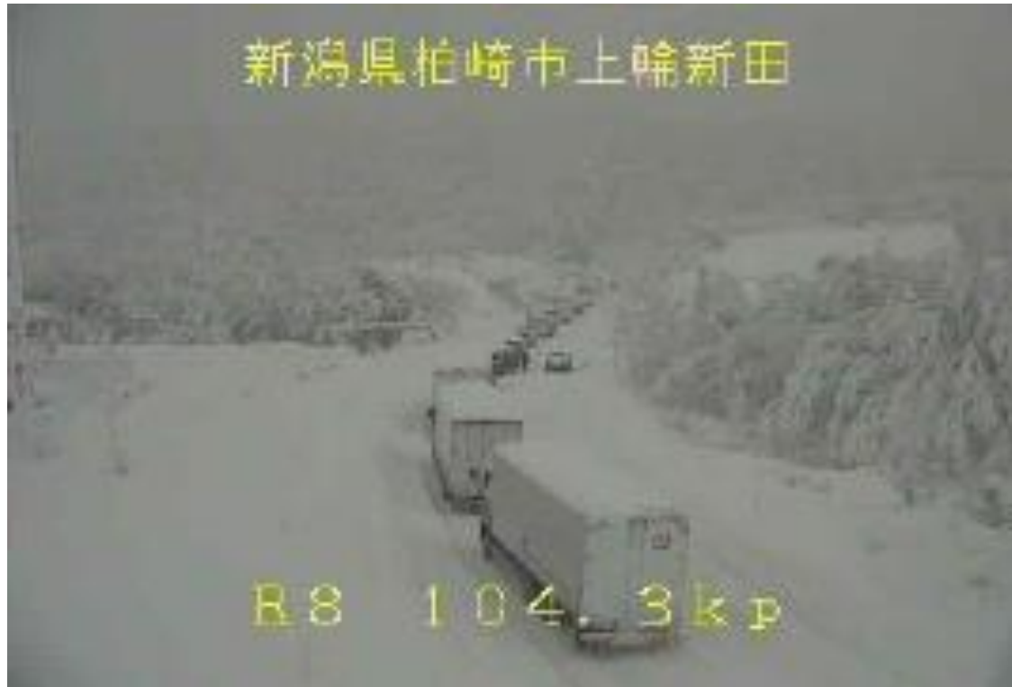
車両の滞留 ＜国道8号＞