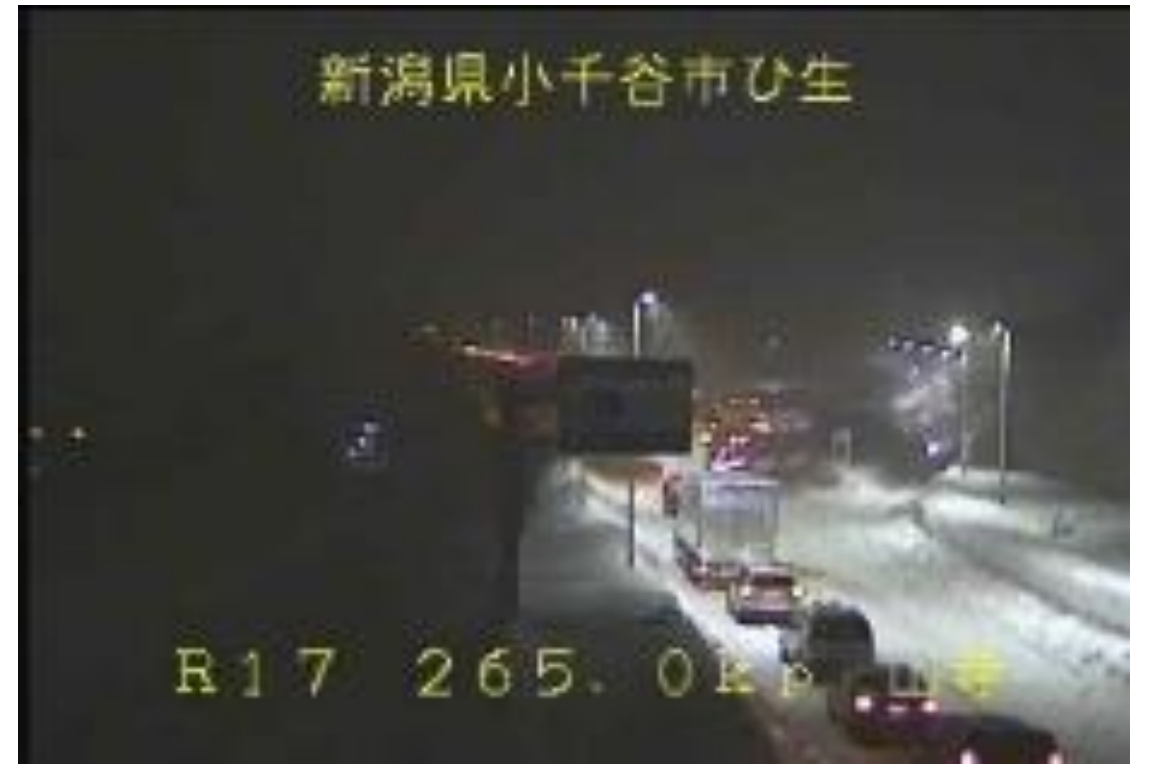
車両の滞留 ＜国道17号＞