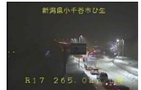
新潟県小千谷市ひ生 国道17号の車両滞留状況 <令和4年12月20日>