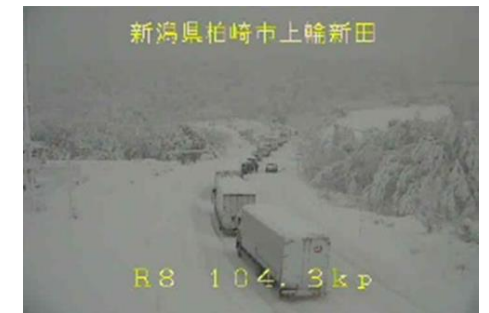
新潟県柏崎市上峰新田 国道8号の車両滞留状況 <令和4年12月19日>

○新潟県見附市から長岡市の国道8号・17号では、車両の立ち往生が断続的に発生し、12月20日3時から32.7kmが通行止めとなり、全面的な通行止めの解除までに約29時間を要しました。