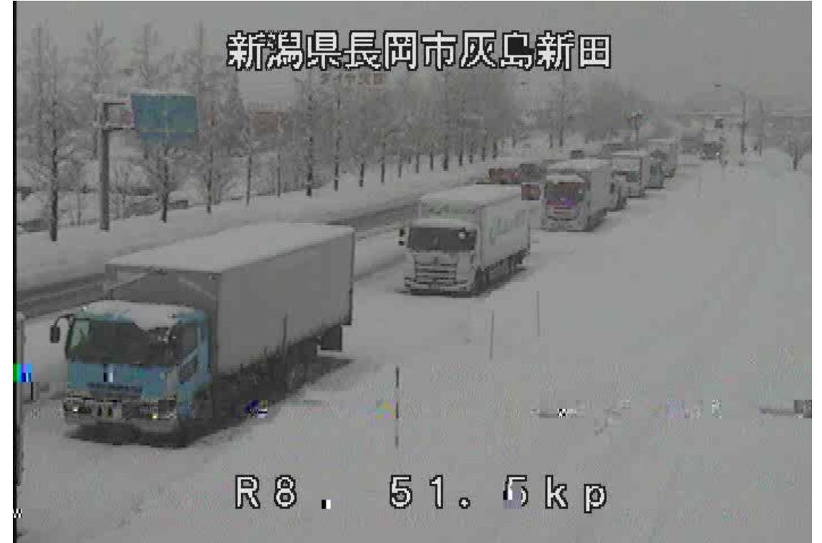
車両の滞留 ＜国道8号＞