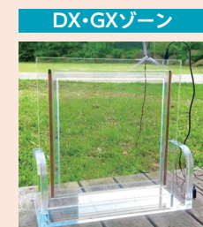
無色透明光発電素子 inQsの「光発電ガラス」