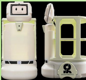
SOCIAL ROBOTICS(株) 自走式運搬ロボット「BUDDY」