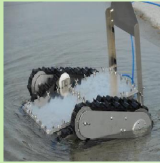
福島工業高等専門学校 「水中クローラロボット」